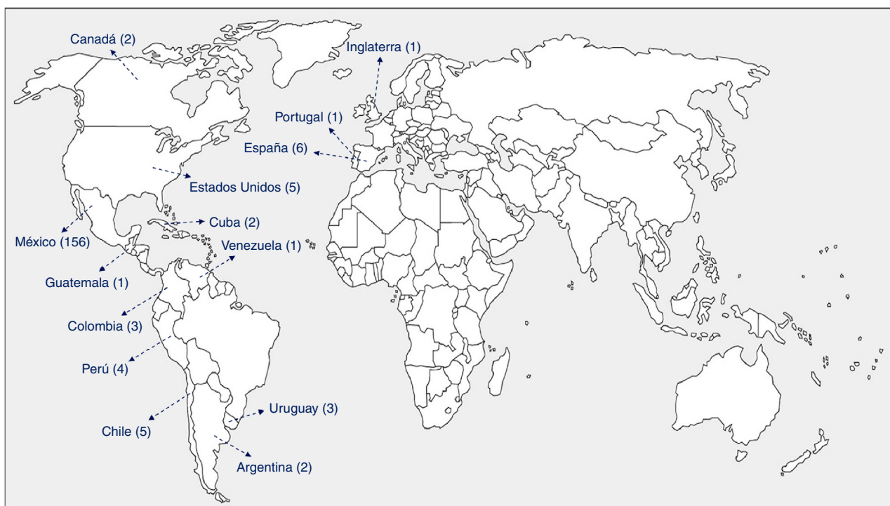
Figura 1 Afiliación de los autores.

Nota: se excluyeron los trabajos publicados en las secciones «NECS» y «Resúmenes».