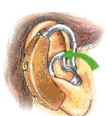
ಇಲ್ಲ ತೋರಿಸಿರುವ ಹಾಗೆ ಭದ್ರವಾಗಿ ಕೂರಿಸಲು ನಿಧಾನವಾಗಿ ಕಿವಿ ಅಚ್ಚನ್ನು ಒಳಗೆ ತಿರುಗಿಸಿ