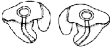
दाएँ और बाएँ कान का साँचा

कान का साँचा एक प्लास्टिक या सिलिकॉन प्रविष्टि है, जो कि श्रवणयंत्र के रिसीवर की सहायता से प्रवर्धित ध्वनि कान की नली और कान की झिल्ली तक पहुँचाता है।